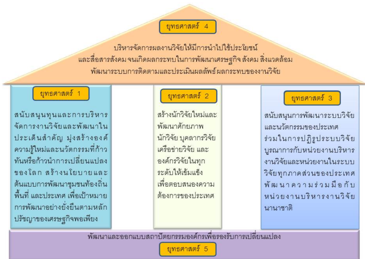
แผนภาพที่ 2 แผนที่ยุทธศาสตร์ (Strategy Map) ของยุทธศาสตร์ สกว. พ.ศ. 2560-2564

สานพลังการวิจัยและนวัตกรรม เพื่อเปลี่ยนประเทศไทยสู่ประเทศพัฒนาแล้ว อย่างยั่งยืนตามหลักปรัชญาของเศรษฐกิจพอเพียง ภายใน 20 ปี